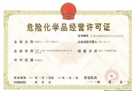
新加坡辦公室 ISO 證書 上海辦公室 ISO 中文證書 上海辦公室 ISO 英文證書 上海辦公室危險品經營許可證