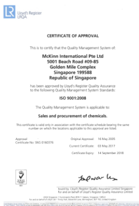
新加坡办公室 ISO 证书