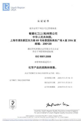
上海办公室 ISO 中文证书