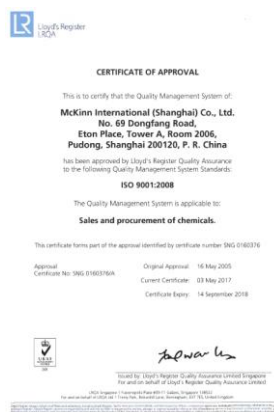
上海办公室 ISO 英文证书