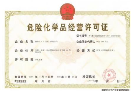
上海办公室危险品经营许可证